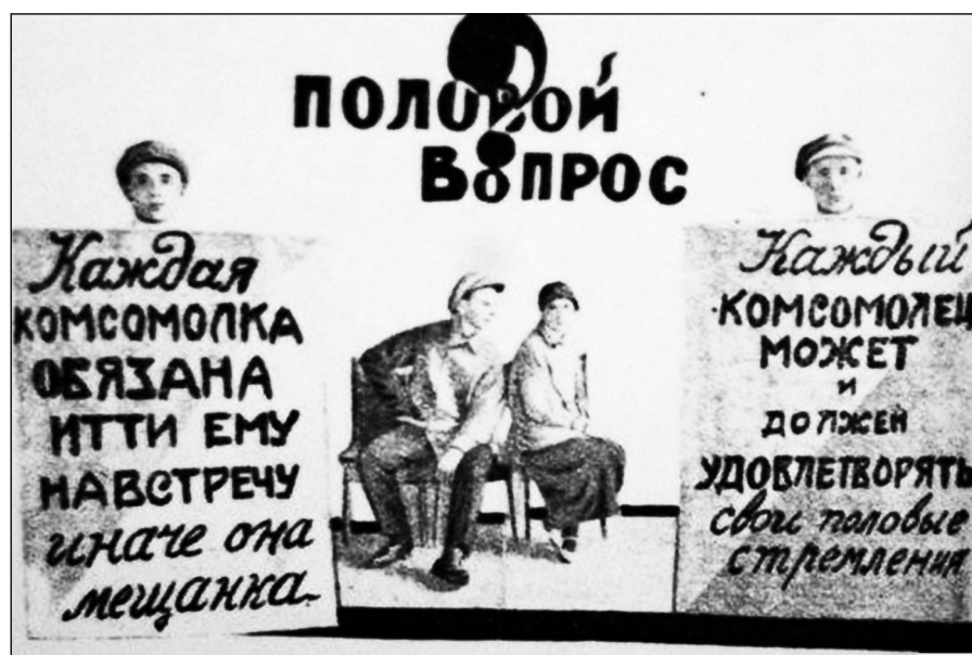
Советский плакат 1920-х гг.

Одной из серьезных проблем, стоявших перед советскими идеологами, был воскресный день недели российского календаря. Мало того, что он имел религиозное значение 9 , которое было закреплено в его названии, он еще был первым в очередности дней недели (современные европейские календари сохранили традиционную очередность дней недели), а также нерабочим, выходным, по сути – праздничным. В рамках идеологической борьбы с этим религиозным элементом повседневной русской культуры с 1929 г. в соответствии с Постановлением Совета народных комиссаров СССР «О переходе на непрерывное производство в предприятиях и учреждениях СССР» семидневная неделя была заменена на пятидневную, а с 1 декабря 1931 г. – на шестидневную. Данные календарные преобразования осуществлялись с целью разрушить религиозную значимость воскресного дня. Эта цель становится очевидной при сравнении со-