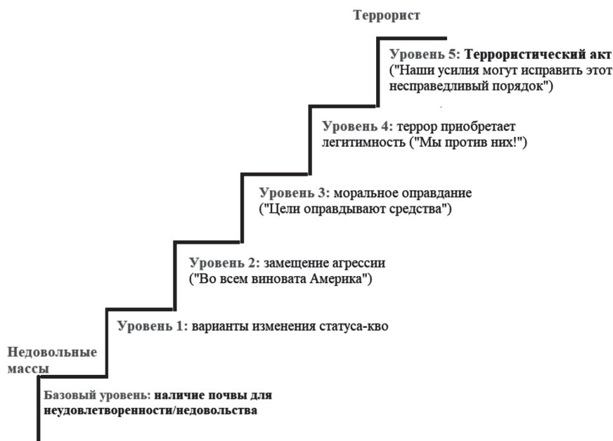
Рис. 1. «Лестница терроризма»

Неудовлетворенность своей идентичностью. Согласно Ф. Мохаддаму, наиболее важным аспектом в социальных условиях является то, как люди отвечают на вопросы, которые касаются их идентичности, как на личном , так и на коллективном уровне. Для любого человека важное значение имеют ответы на вопросы: «Каким типом личности я являюсь? Ценят ли меня? Прислушиваются ли к моему мнению?» на личном уровне и «К какой группе я принадлежу? Ценят ли мою группу? Прислушиваются ли к мнению моей группы?» на коллективном