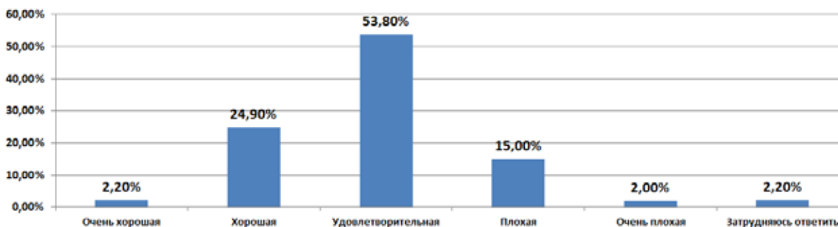
Оценка студенчеством ситуации в сфере отечественного образования

сов: «Как Вы оцениваете ситуацию в сфере отечественного образования?», «Удовлетворены ли Вы образованием, получаемым сегодня в средней школе?», «Удовлетворены ли Вы образованием в университете?», «Если Вы не удовлетворены, то чем именно?», «Какие изменения произошли в системе образования России за последние пять лет?» Ответы, полученные на вопрос об оценке ситуации, сложившейся в сфере отечественного образования, свидетельствуют о низком рейтинге в молодежном сознании образовательной системы России (рисунок). Почти три четверти опрошенных (суммарно – 70,8%) дали невысокую оценку нынешней системе образования, из них 53,8% оценили ее как удовлетворительную, 15% – как плохую и 2% – как очень плохую. Только четверть участвующих в исследовании дали ей хорошую оценку. Исключение составляют респонденты из села, среди которых в 1,6 раз больше, чем по массиву, доля оценивших отечественную систему образования как хорошую (40% против 24,9%). Большинство опрошенных (две трети) отметили, что они не совсем довольны получаемым образованием. Особенно высокий уровень недовольства высказан респондентами по обучению в средней школе: 84,3% отметили, что они не довольны процессом обучения в средней школе, из них полностью неудовлетворенные составляют 17,6%.