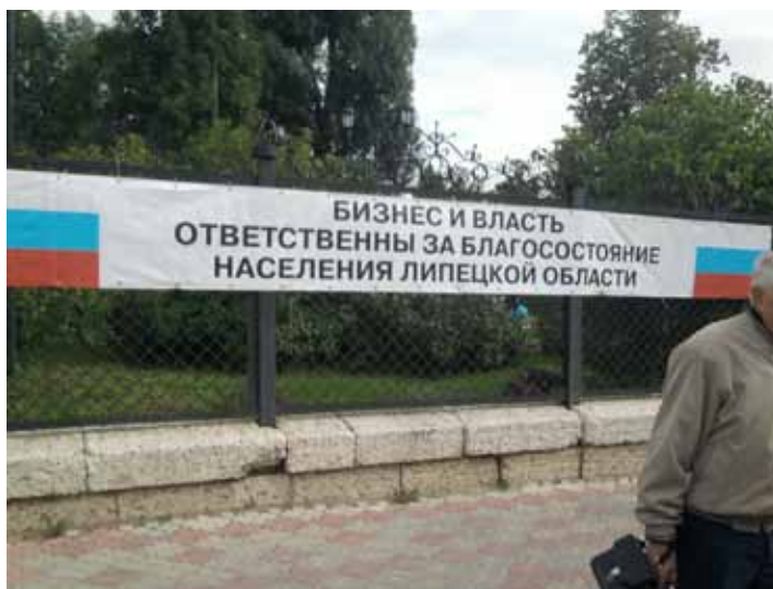
Фрагмент с одной из елецких ярмарок. Елец. 2012 год. На ограде городского парка висит плакат с недвусмысленным содержанием, по сути дела, подтверждающим доминирование политического над культурным

обходимых политических смыслов (фото). Что касается Ельца, то культурная сфера здесь практически полностью подчиняется политической воле. Несколько лет назад появилась практика устанавливать на крупных ярмарках широкий экран, по которому горожанам демонстрируют свои месседжи представители как федеральной, так и местной политической элиты. В Ельце многие культурные практики замыкаются на мифе о Ельце как о городе воинской славы – демонстрация указа В. Путина, наделяющего город таким званием, является едва ли не самым популярным и системообразующим нарративом, обеспечивающим политические практики местной элиты необходимым идеологическим и культурным содержанием.